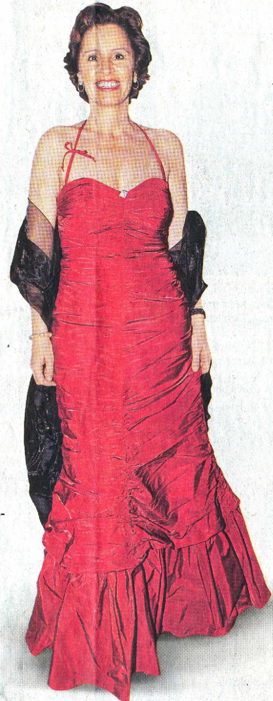
Sozialministerin Christine Haderthauer